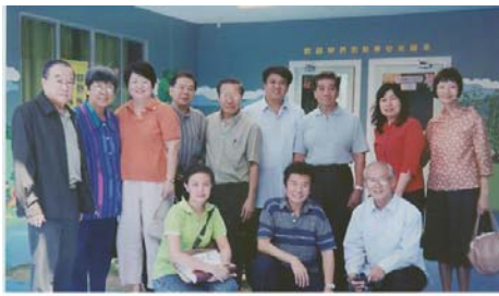
僑中校友會職員參觀新華校園。