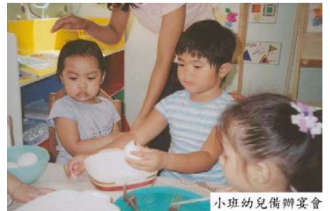
小班幼兒備辦宴會

第一屆怡朗新華學院夏令營自二〇〇四年四月十四日開營時已有一百三十多位學生踴躍參加各個學科共計十二款的活動：朗誦，演講，數學，華語，普通話會話，英語閱讀，韻律體操，芭蕾，新聞寫作，幼兒樂園。夏令營的成功離不開新華董事會，每位老師的努力和艱苦細致的準備工作。更值得一提的是我校不但接收幼兒，中小學生來校報名，而且還有大學生和專業人員報名參加成人普通話課。(仁慈)