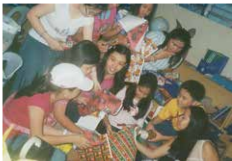
學生會職員在課餘忙著包裝禮品準備於聖誕節送給「街頭兒童」

他們從小必須就懂得同情生活困苦的人。這次捐獻的東西雖微薄，但如果能見到「街頭兒童」他們臉上露出快悅的笑容，在這個寒冷的季節里給他們帶來少許溫暖，我們也會感到高興的。(仁慈)