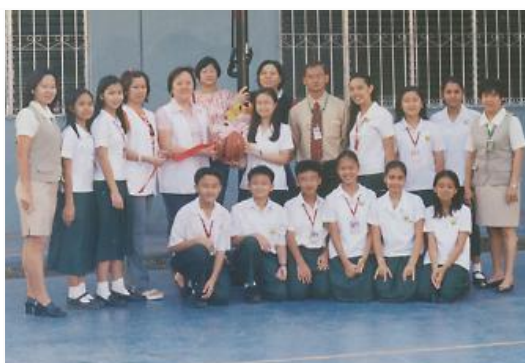
家長會捐贈籃球架

春節剛過去，祈求乙酉年新春能給大家帶來更多的希望和毅力。肯於克服任何艱辛。用我們的愛心為家人、為人群多做些好事。（三好）