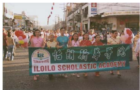
新華遊行隊伍步入會場