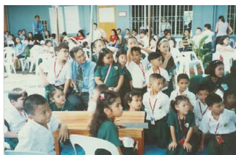
校慶回顧：聚精會神觀看比賽

此外，學校每日還為數學基礎特別好的新華各年級學生專門開設“數學強化訓練班”。被錄取加入剛組建的乒乓球、羽毛球、游泳和田徑隊的新華學生也將於四月底開始接受由學校聘來的專業教練的訓練。(小芬)