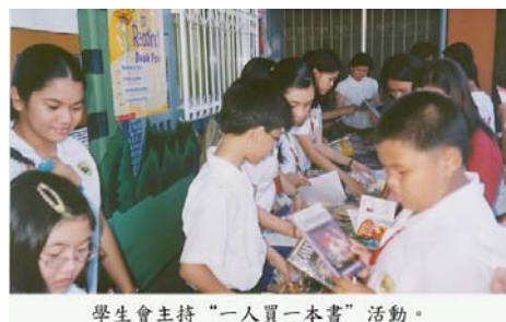
學生會主持“一人買一本書”活動。

九月三十日，學生自治會舉辦了首屆校園書展。看到那些在書店一般覓不到的好書，許多小朋友也識貨似地每人手拿幾本。今天家長們讓他們多帶些錢購書。一大早學生會職員剛要擺攤，他們已經在那兒等候多時了。看來，學校‘每人買一本書’的號召是在起作用了。今天校園的焦點並沒有全被書展所壟斷，操場另一邊的各科知識競賽活動也同時如火如荼地進行著。小孩們更是忙著跟大紅狗‘凱佛’合照。但我的注意力多半還是放在書攤上，流連忘返，細心選購心愛的書籍。我非常喜愛 Scholastic 的出版物，它們老少皆宜。一些以前極少涉獵圖書的小孩子現在也都沈浸在知識寶庫裡頭。僅這一點我可以說書展是成功的。好了，你們還在等什麼？暫時放下其他東西，拿起心愛的書籍閱讀吧！(小文)