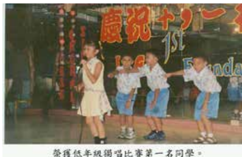
榮獲低年級獨唱比賽第一名同學。