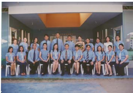
怡朗新華學院 2004~2005 學年度全體教職員合影

為了較客觀地瞭解我校學生的知識水平，從另個角度衡量我校教學水準的高低，新華委託岷市的“亞洲心理測試服務公司”(APSA)于二月十七、廿四日上午分別對幼二及小一至中一的學生進行英語、數學和科學三科目的考試。幼二班小朋友用了一小時左右答完考卷。中、小學生大約用了三個鐘頭考完三個學科。兩週後考試結果由該公司郵寄到我校。欲知有關測試結果的數據請參閱本期英文版。此處恕不另列。(小芬)