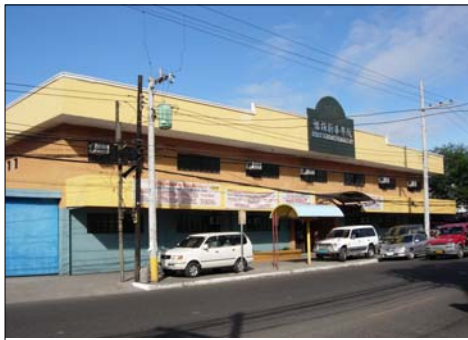
怡朗新華學院校園外景