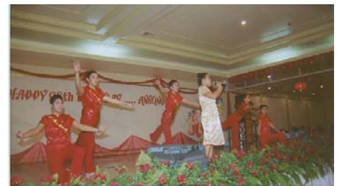
清芬演唱“我的祖國”。

想來我們不必再遲疑，現在就買來一些 Charlie Chaplin 的綠影片來欣賞吧！（小五安禮）——（三好）