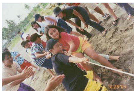
加油！加油，為我隊再爭來一分！

十一月二十八日至三十日，學校舉辦了第一屆露營。由小四至中一學生參加的該項戶外活動選址於靠海邊的“很好玩露營場”。學生分為紅、藍、青、黃四隊。四個隊在兩天內進行了毫不相讓的競賽。孩子們學著豎築帳篷；連用餐前排隊盛飯也是秩序井然，紀律嚴明。這次活動的重要目的之一是讓孩子們歡歡樂樂地跟同學們一起生活。讓大家過上一段難忘的時光。(小文)