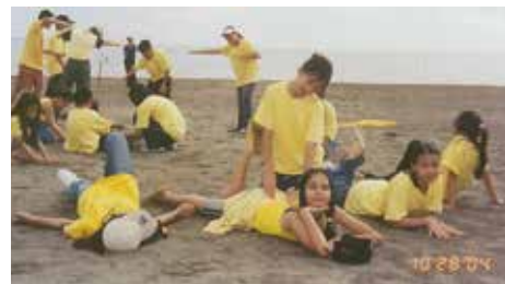
露營一景：猜猜看，這是什麼圖形？

「聖誕」一詞是國人最熟悉不過的節日名稱了。在我國，一年一度的聖誕節牽動了多少人的心弦！早在十月初，街頭上就響起了歡快悅耳的聖誕經典歌曲，商店裡裡外外點綴著五彩繽紛的聖誕飾物，處處洋溢著喜樂的節日氣氛。但所謂的天有不測風雲，人有旦夕禍福，世上無十全十美之事，正當人們準備歡度佳節的時候，百年一遇的強烈風暴，「育勇」席貫了東、北呂宋島。物產損失慘重，上萬災民無家可歸、民不聊生。眼看同胞們水深火熱，學生會毅然發動支援災民三天捐款運動。動員全校同學發揚人道主義精神，把零用錢捐出來救接受受苦的同胞。我師長家長反應熱烈，在短短的三天內共捐了一萬三千六百八十二元五角。他們用行動實踐了‘聖誕是給予’的諾言！（三好）