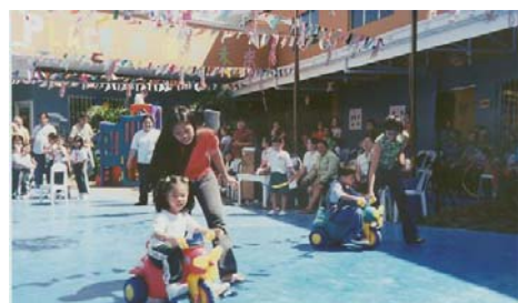
幼兒園懇親會一景：騎車比賽

新華學院幼兒部於八月二十七日舉行團體操洎體育運動大會。團體操項目多姿多彩，幼兒們都興高采烈地把他們的材藝展示給大人們看。遊戲比賽更是熱鬧，家長和兒女一起參加比賽，這樣的活動很受家長們的喜愛。親子之情十分融洽，笑聲滿場，氣氛作常熱烈。(三好)