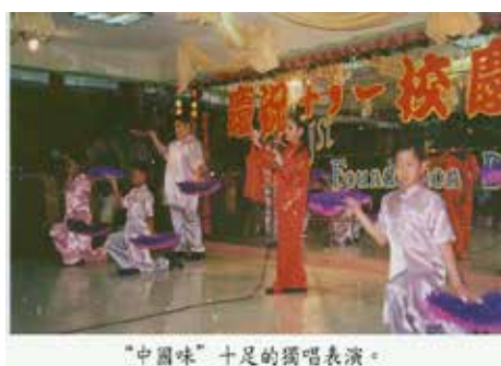
“中國味”十足的獨唱表演。

數位英文老師在百忙中抽空排練了一齣題目為《神鳥》的木偶戲。這是九月三十日國際文化節的其中一個重要節目。故事講述了一個國王病重了，為治癒他的疾病，他的三個兒子需得翻山越嶺尋找能給父王治病的神鳥，故事著重描繪了他們所遇到的種種艱難險阻。故事的主題是教育孩子們要懂得樂以助人、謙虛謹慎、誠實敦厚的美德。孩子們在欣賞藝術表演的同時也學到了重要的人生道理。(小文)