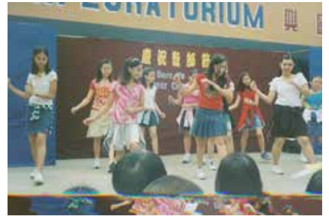
教師節：小六班女同學表演舞蹈

面對豐盛的食物和將要互相交換的禮物，個個歡樂無比。但是，我們並沒忘記聖誕的真正意義——互相關心和互相愛護。(仁慈)