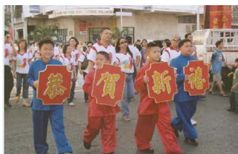
新華董事師生向怡朗市民拜年！

春節臨到，怡朗市街上華人商店都掛燈結彩。五顏六色的中華傳統的裝飾品點綴著整條街道。令人感覺到新春委實已降臨人間。