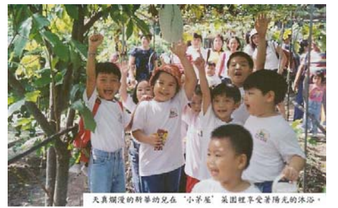
天真爛漫的新華兒女在‘小茅屋’菜園裡享受著陽光的沐浴。

幼兒園師生於七月九日率先遊覽農場。他們除騎馬，坐牛、羊車，釣魚外，每班小朋友還準備節目。老師們也不忘準備遊戲和獎品。