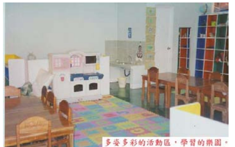
多姿多彩的活動區，學習的樂園。