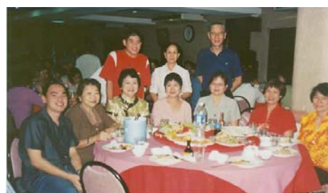
“十·一”坐在貴賓席上的評委和貴賓。