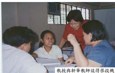
教授與新華教師談得很投機

Ozamis 市四位教師和 Santa Isabel 的校長聞訊也前來參加講習會。(怡江)