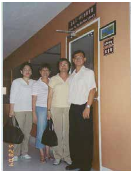
熱心人士捐獻五十萬元建造圖書館

為保證教學質量的不斷提升，我校採用教育部於去年開始在公立學校施行的“百分之七十五及格標準”，即：一百道題中學生應至少答對七十五題始能及格。與此同時，我校教師也是嚴格按照七：二：一的標準出題，即：容易題佔 70%，一般題佔 20%，困難題佔 10%。(怡江)