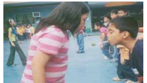
小五班同學在進行聖誕節遊戲

赴賽的學生們是由 Hazel Villa 小姐主持的第一批新聞寫作訓練班學員的一部份。他們於八月市際比賽獲得參賽資格的。自本月起，第二批新聞寫作訓練班共七名學員也開始開班。兩班共計十九名在接受系統的新聞寫作訓練。這對提高我校學生英文寫作的總體水平將起到積極的模範作用。(三好)