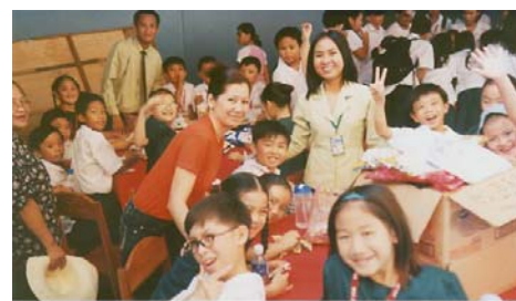
同學們興高采烈玩“色子”。

排練數星期的幼兒、中小學生，個個滿懷信心地在台後等候輪到他們上台。幼兒們表演念歌謠、集體表演唱；中小學生表演芭蕾舞、獨唱、舞蹈，話劇：‘嫦娥奔月’。