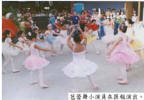
芭蕾舞小演員在匯報演出。

現在是需用教育喚醒孩子們對文化的熱望的年代。為孩子們準備好將來，鍛鍊自我，履行職責。拒絕接受學問的孩子無疑是與成功絕了緣的。所以教育是我們國人最需要的東西。（小文）