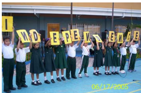
小一學生祝大家獨立節快樂

為了紀念來之不易的獨立節，新華師生們利用課餘時間，加緊排練節目。於六月十七日上午表演了充滿愛國題材的歌舞、朗誦和短劇。這也讓同學們有機會施展他們的藝術才能。同時也教育同學們要珍惜現在美好時光。真可謂一舉多得。(小芬)