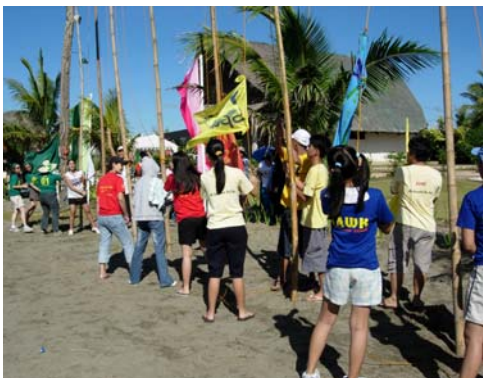
五隊正等著升隊旗的號令

露營的意義已超出了活動本身。他給了同學們許多在課堂裡難于學到的各種知識和技能。如自立互助，在更為自然的環境下學會待人接物、與人相處。