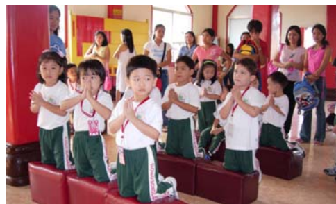
多虔誠的小香客！天真無邪的兒童們跪在聖像前祈禱，祈求神明保佑自己健康成長