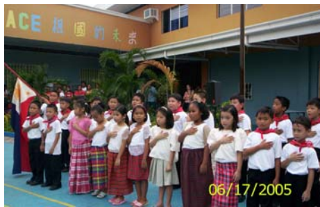
小二學生合唱民族歌曲