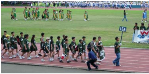
新華運動員在開幕式上走進會場

小選手都牢記學校的教導，參加比賽重在參與，臨場要頑強拼搏，為個人和母校爭來榮譽，與友校的運動員建立友誼。