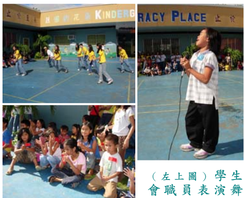
位能歌善跳舞的小孩最受觀眾們的喜愛；（左下圖）小觀眾為表演者喝采。