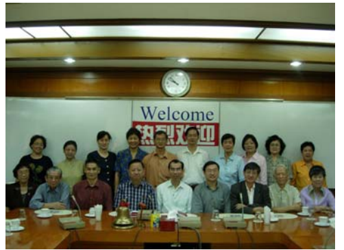
考察團全體團員飛赴深圳前在僑中學院會議廳舉行行前會議並合影留念

全團共有十九人參加，其中有兩名是董事長（密三密斯中華和蜂省大同）。主辦者分配給米獅焉地區的四個名額中有三個空缺，新華是唯一有人員參加的米獅焉華校。