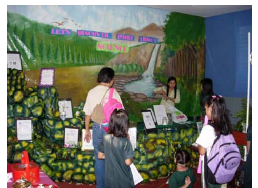
為迎接九月廿八至三十日三天的‘開放日’，各年級都把課室布置得花枝招展，光彩奪目。每個角落都按照各科目的內容放著實物、圖片、學生作品、作業紙……在老師的催促下，每個學生都日以繼夜地讓自己熟悉需要解釋的項目內容，把需要預先背下來的詞句背得滾瓜爛熟。到目前為止應邀並有意前來參訪的學校有八所左右。