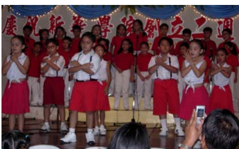
小三、四同學表演唱‘天下的媽媽都是一樣的’

“新華所奉行的教育路線不是某個人憑空想出來的，它是校董會和學校當局理想、廣大家長的心願、老師的企望和學子的憧憬的高度概括。這四方面人群的互動就是新華活力的源泉。事實表明，只