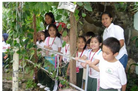
參觀蝴蝶館。孩子們猶如走進綠色世界，心曠神怡，不但學到了科學知識，還受到大自然的感染；學會尊重自然，熱愛自然