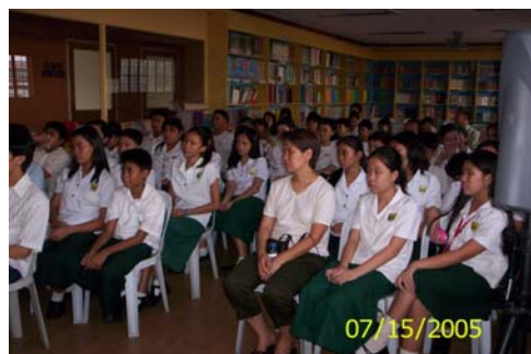
高年級學習者和幾位來賓專心聽講

為幫助學習者解答一些學術、品德行為等方面的疑問，從而提高他們的知識和道德修養水平，學校當局經常邀請學者、專家臨校主持此類講座。