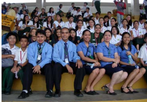
場場少不了他們身影的新華師生們，他們臨場自發組織的啦啦隊，為我運動員熱情地鼓氣加油。這是他們出席開幕典禮的情景。