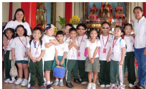
孩子們和導師在瑤池金母媽聖像前留影

幼兒園春遊。一百名幼兒在導師的帶領下於本月十七日朝聖座落於市區的瑤池金母壇、參觀怡朗博物館和遊覽中央大學的蝴蝶館。