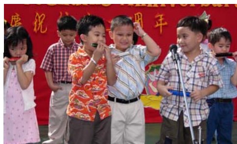
幼一的五歲小朋友也能吹口琴，太不可思議了！

幼兒部於九月廿六至卅日舉辦一系列活動慶祝世界文化月。在老師的指導下，兒童們一週內忙著製作手工藝品，繪製圖畫，剪貼圖紙，把製成品都張貼在課室每個角落。整間課室頓時變成了藝術展覽室；準備給家長們和應邀前來參觀的外校師生們一個大眼福。