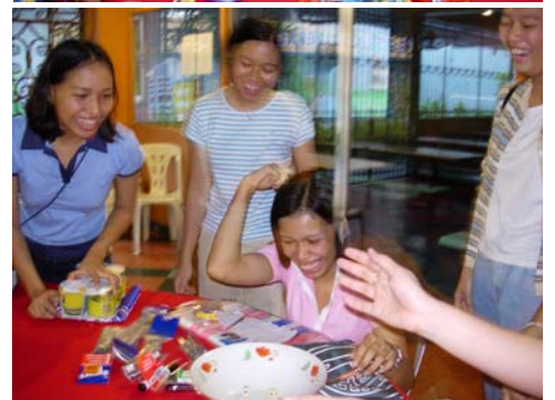
(上圖)九月十六日上午從幼兒到中二共三百名學生分十九桌在操場上玩色子，歡度中秋佳節；加上低年級學生的家長圍觀熱鬧，校園一時沸騰起來，歡聲笑語此起彼伏。(下圖)下午五點，新華董事們慷慨解囊，備齊貴重獎品和獎金讓全體教師職工玩這種富有中國閩南傳統特色的遊戲，特別是英語教師，許多還是第一次體驗到‘賭中秋’的樂趣。