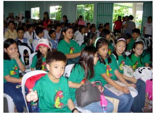
九月十日及十一日，由教育部舉辦的本年度新聞寫作講習會暨寫作競賽在 Barotac Nuevo 社舉行。十幾所公私立學校派了三百多名學生參賽。圖中是新華廿九名參賽者的一部分。他們當中不乏初出茅廬的小三、四年級的新秀。兩天競賽成績揭曉：新華三名參賽者獲第一獎；獲第二、三獎各兩名；獲第四獎的有三十人次。