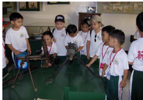
男孩們對博物館陳列的二戰機槍深感興趣