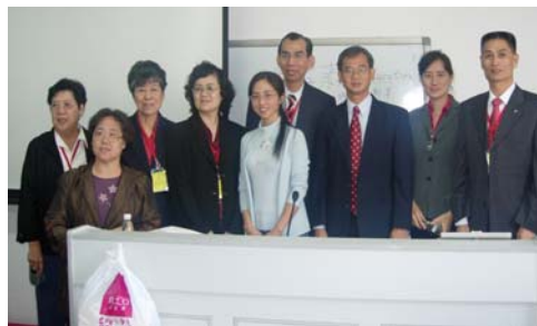
聽‘學校管理心理學’講座後與講師合影

除參觀學校外，團員們還聽了四場有關學校管理和心理學的講座。參觀了穗、渝兩地的名勝古蹟、瞭解當地的人文景觀、城市建設和未來二十年的規劃。十二天的參訪活動安排緊湊，收穫甚豐。膳宿條件無可挑剔。僑辦委託的接待單位暨南大學和重慶師範大學的負責人更是照顧有加。