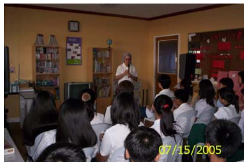
Fidelis 修女第二次蒞校主持講座