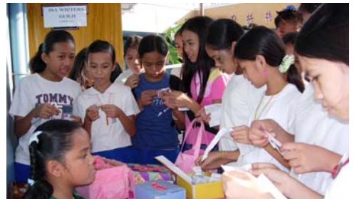
這是校友學生參觀各展室後到數學角猜題的情景

新華學院於九月廿七至廿九日舉辦了三天對外公開綜合展覽會。把八個課室改裝成風格各異的展室。每個展室一律分成四個角：英語、華語、科學和社會科目。此外，在操場旁邊擺上了數學角，供來賓參觀後到那邊猜題贏得獎品。