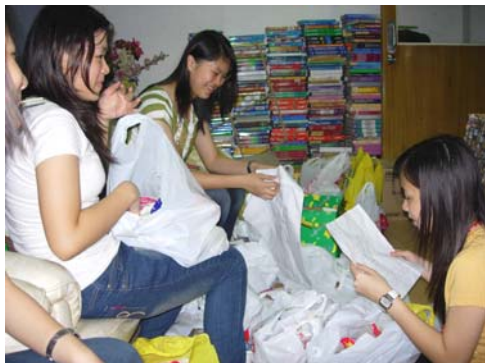
學生會職員利用課餘時間把同學們捐贈的食物和日常用品分類後裝在塑料袋裡準備於十二月二十日送給利薩居民區的貧民。