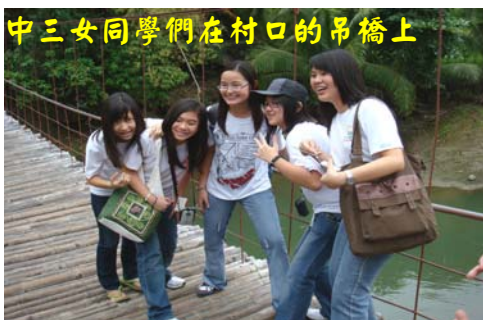
中三女同學們在村口的吊橋上

當他們回到怡朗新華學院時，天都很黑了。但那一天的經歷對每一個人來說都是充滿著教育意義的。