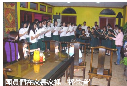
團員們在家長家裡「播佳音」

雖然在這活動過程中不乏瑣事，如搬運樂器等，但我們可以看到每位參與者都樂在其中。他們自身的付出與家長的支持都確有所值，共享的短暫時光給他人帶來了莫大的樂趣。